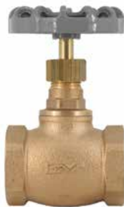
青铜截止阀 产品系列：S906/04