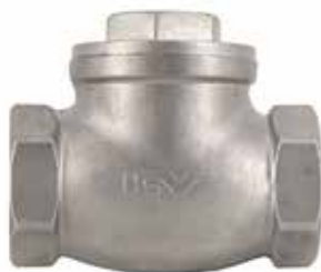
不锈钢止回阀 产品系列：S907/03