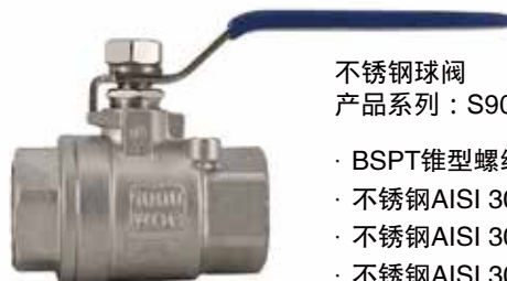
不锈钢球阀 产品系列：S907/04