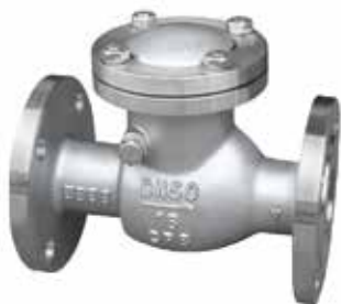
产品系列：S904/02 不锈钢旋启式止回阀