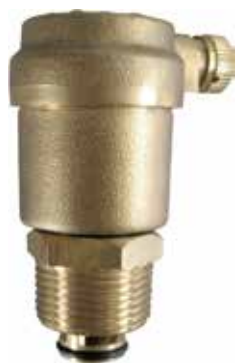
自动排气阀 产品系列：S912