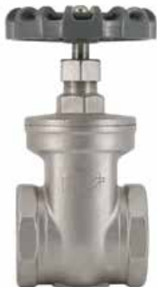
不锈钢闸阀 产品系列：S907/01