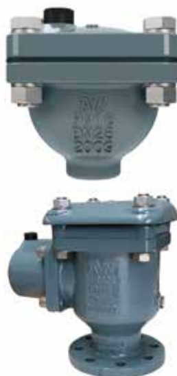
多功能排气阀 产品系列：S851