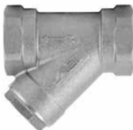
不锈钢过滤器 产品系列：S910/06