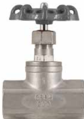
不锈钢截止阀 产品系列：S907/02