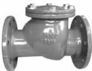
产品系列：S904/03 旋启式止回阀