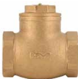
青铜止回阀 产品系列：S906/06