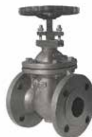
产品系列：S901/02 暗杆闸阀