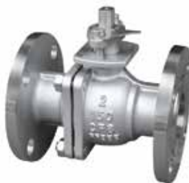
产品系列：S907/08 不锈钢球阀