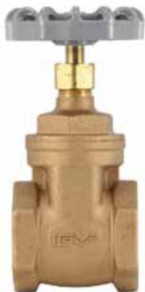
青铜闸阀 产品系列：S906/02