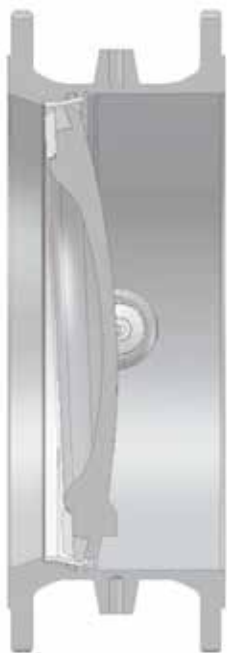
倾斜式阀瓣 · 延长使用寿命