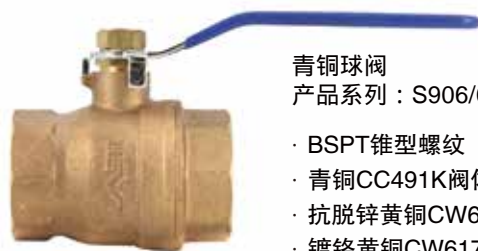
青铜球阀 产品系列：S906/08