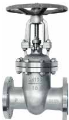
产品系列：S901/03 不锈钢明杆闸阀