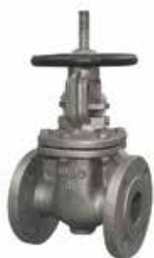
产品系列：S901/01 明杆闸阀