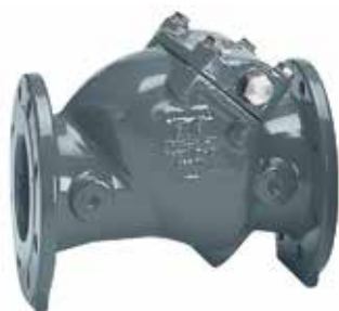
旋启式止回阀 产品系列：S41