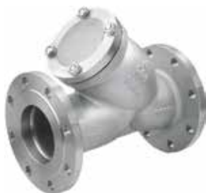
产品系列：S910/05 不锈钢过滤器