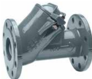
球型止回阀 产品系列：S53